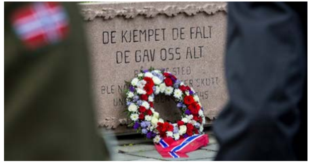
Frigjøringsdagen markeres over hele Norge.

Frigjøringsdagen inkluderer offisielle seremonier, minnemarkeringer og paradeoppvisninger, der veteraner og nåværende militære styrker deltar for å hedre de som kjempet for landet. Det er vanlig med taler fra politiske ledere, kongefamilien og andre offentlige personer, der de uttrykker takknemlighet og anerkjennelse for ofrenes innsats og det norske folks motstand mot okkupasjonen.